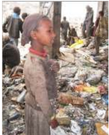
የወያኔ ድርብ ቀመር የልማት ውጤት በተግባር ሲመዘር ሕጻናትን ከቆሻሻ አስለቅሞ ያስበላል።

ለማጃ ቀጣፊ የኢትዮጵያ ጠቅላይ ሥቃይ መለስ ዜናው መጋቢት ፳፯ ቀን ፪ሺ፫ ፓርላማዬ በሚለው በረት ውስጥ ለኮለኮላቸው ድብኝት አሻንጊቶቹ ሲናገር፤ ድርብ ቀመር የታየበት ዕድገት አሳይተናል ብሎ ቀበጠረ። አቤት ውሸት! አቤት ውሸት! ሀቁ መሬት ላይ እንደሚታየው ከሆነ አብዛኛው የኢትዮጵያ ሕዝብ የሚላስ የሚቀመስ አጥቶ፤ ጠሙን ውሎ ጠሙን ያድራል። አለው የሚባል፤ ዛሬ ቁርስ ከበላ፤ ምሳን አሰቦ የሚውል ዜጋ ነው። እንዲያውም ምሳና ቁርስ አንድ ላይ የመብላት ዘዴ ዘይደል ። እሱም ምግብ ከተባለ፤ አንድ ሙዝና አንድ ቁራጭ ዳቦ ናት። ያቺም “ቁምሳ” የሚል ስም ወጥቶላታል። የወያኔ የውሸት ቱልቱላ ሲነፋባቸው ስልቸት ያላቸው የኢትዮጵያ አርቲስቶች፤ “ፈረቃ” የሚል መዘቃዊ ድራማ አዘጋጅተው በዚያን ስምን አዘናኑ። ካለዩት የሚከተለውን ተጭነው http://www.youtube.com/watch?v=XpJYkJoWmlc እርስዎም ይዘናኑ።